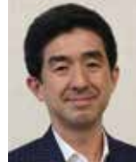
日本政策金融公庫 専務取締役 浜辺 哲也