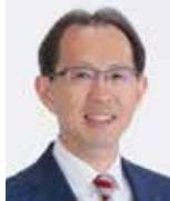
福島県 知事 内堀 雅雄 氏