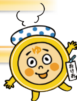
愛知県浴場組合 公認キャラクター