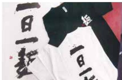
組合選元事業一例

経営安定のため 資金斡旋 福利厚生 共済事業 など行っております。 ぜひ、入会をお待ちいたしております。