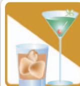
社交業 (スナック・バーなど)