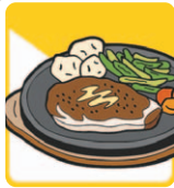
その他の飲食店 (食堂・レストランなど)