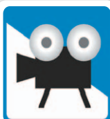
興行場 (映画館・劇場・寄席)