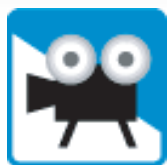
興行場 (映画館・劇場・寄席)