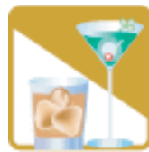
社交業 (スナック・バーなど)