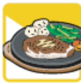
その他の飲食店 (食堂・レストランなど)