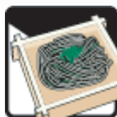
めん類店 (そば・うどん店)