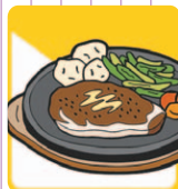
その他の飲食店 (食堂・レストランなど)