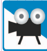
興行場 (映画館・劇場・寄席)