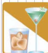
社交業 (スナック・バーなど)