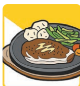
その他の飲食店 (食堂・レストランなど)