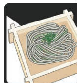
めん類店 (そば・うどん店)