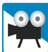
興行場 (映画館・劇場・寄席)