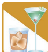
社交業 (スナック・バーなど)