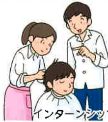
インターンシップの実施

組合を窓口とした日本政策金融公庫の低金利・長期返済の融資により経営の安定を支援しています。