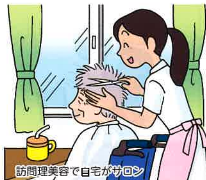
訪問理美容で自宅がサロン

生活衛生業は、訪問理容・訪問美容等の要介護者等に対する在宅生活支援サービスの提供、健康食メニューや健康入浴等の実施による外出支援サービスの提供など、地域の住みやすさ、街づくりにも貢献しています。