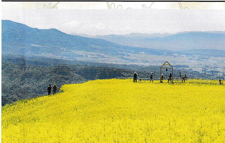
喜多方市【三ノ倉高原花畑】

●発行／(公財)福島県生活衛生営業指導センター 福島市三河南町1-20 コラッセふくしま7階 ☎ 024-525-4085 FAX 024-525-4086