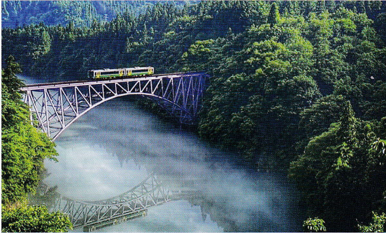
第一只見川橋梁（大沼郡三島町）

●発行／(公財)福島県生活衛生営業指導センター 福島市三河南町1-20 コラッセふくしま7階 ☎ 024-525-4085 FAX 024-525-4086