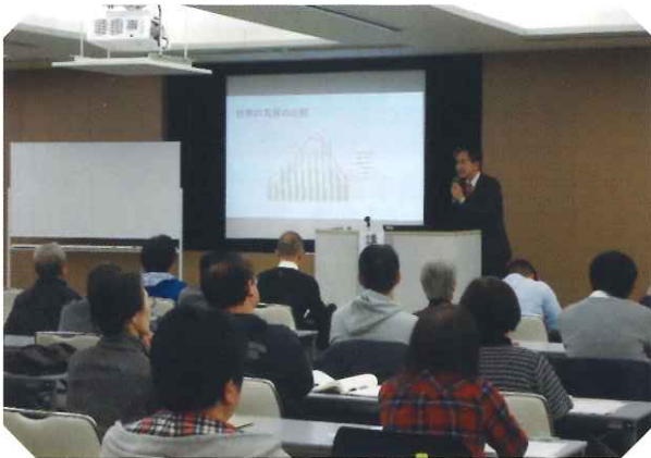
クリーニング師研修会の様子 (令和元年度岐阜会場)

今年度のクリーニング師研修は、次のとおり県内3会場(岐阜・高山・多治見)で開催します。安心・安全を求める利用者や消費者の信頼を確保するためにも、必ず研修・講習を受講しましょう。