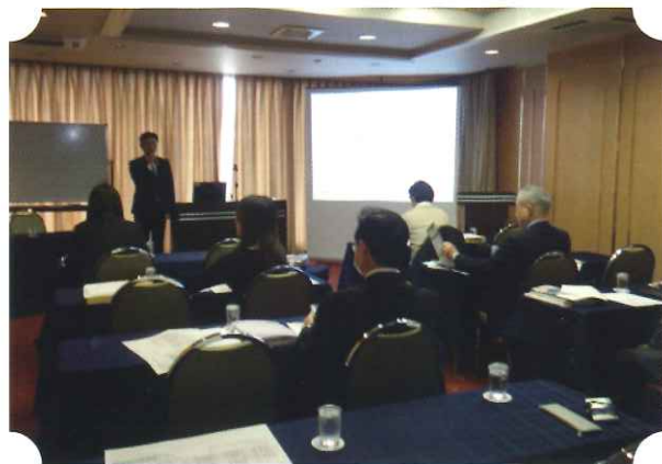
養成講習会を受講されている新任特別相談員の方々

今年度も、新たに5名の方に委嘱されることとなり、本年2月に養成講習会が開催され、4月1日付けで岐阜県知事から委嘱状が交付されました。今後の皆さんの御活躍を期待します。