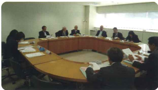
消費者問題について協議を行う関係者

今回は、理容業に関する苦情相談について、一般消費者代表、行政機関（県生活衛生課、県民生活相談センター）及び県理容組合役員の出席のもと、本年2月に協議会が行われました。