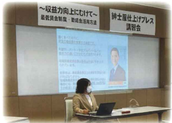
生衛業収益力向上セミナーの様子

また本セミナーについては、開催前・当日と運営スタッフがコロナ感染防止に様々な対策・注意を払い、無事開催することができましたことに感謝します。