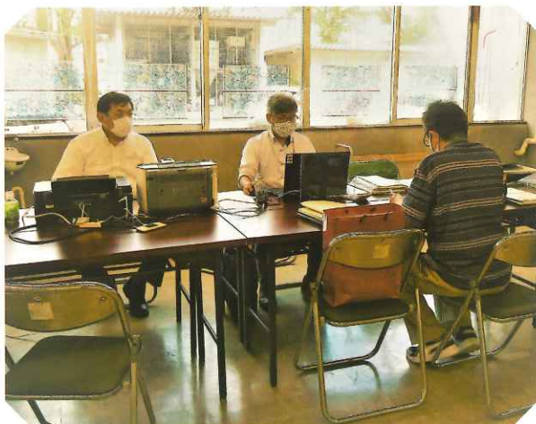
生衛業者対応融資・助成金等利用相談会の様子

これまでに163件（10月末現在）の相談を受けています。相談を受けた生衛業者の皆さんからは、伴走型の相談会で「大変ありがたい」とのお言葉をいただいております。