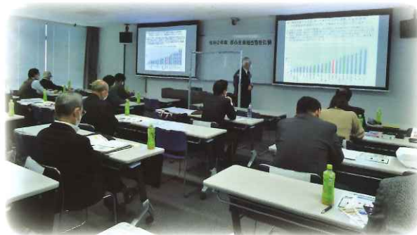
ぎふ生衛組合活性化塾の様子

生衛組合の将来を担う若手組合員、リーダー後継者、事務局職員等を対象に生衛法、生衛組合、生衛業界の現状と課題等を学び議論する研修会を令和3年1月に岐阜大学サテライトキャンパスで開催しました。