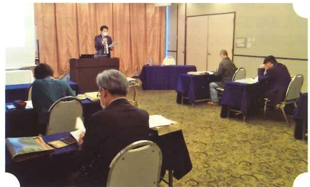
養成講習会を受講されている新任特別相談員の方々

令和3年2月に養成講習会が開催され、新たに4名の方に委嘱されることとなり、令和3年4月1日付けで岐阜県知事から委嘱状が交付されました。今後の皆さんの御活躍を期待します。