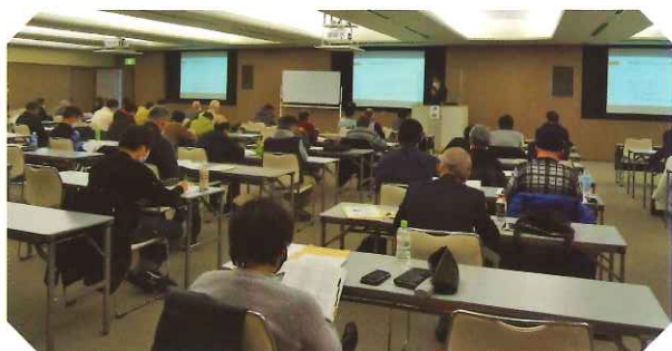
クリーニング師研修会の様子(令和2年度岐阜会場)

今年度のクリーニング師研修は、次のとおり県内3会場(岐阜・高山・多治見)で開催します。安心・安全を求める利用者や消費者の信頼を確保するためにも、必ず研修・講習を受講しましょう。