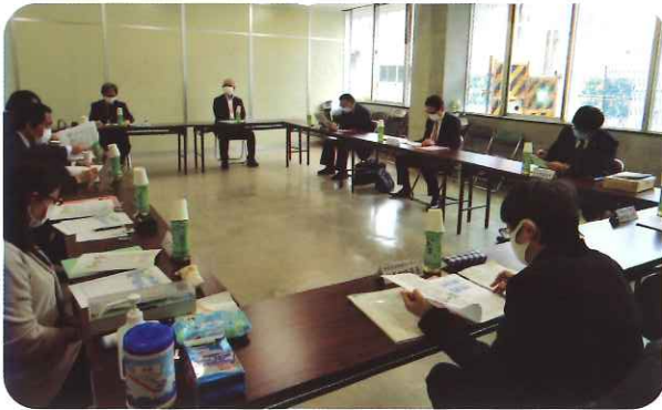
消費者問題について協議を行う関係者

今回は、旅館ホテル業に関する苦情相談について、一般消費者代表、行政機関（県生活衛生課、県民生活相談センター）及び県旅館ホテル組合役員の出席のもと、本年2月に協議会が行われました。