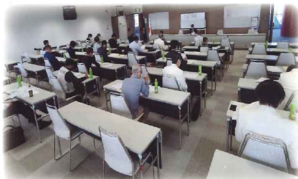
生衛業収益力向上セミナーの様子

ます。コロナ感染が心配される中、沢山の方の参加を得、無事開催、終了することができたことに感謝します。