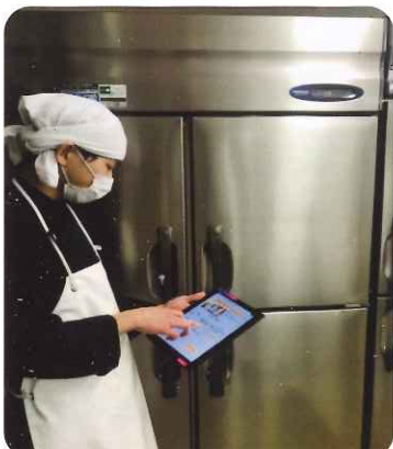
タブレットによる HACCP記録管理

この事業により「衛生管理計画作成の簡素化」、「記録管理のクラウド化」などを図ることができました。さらに、約80%の施設の方から今後このアプリを導入していきたいと回答をいただきました。当組合では、導入に向けて組合員への周知を図ってまいります。