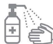
手指消毒用 アルコールによる消毒の励行