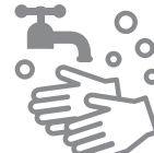
石けんによる手洗い