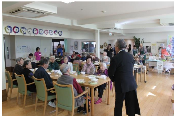
閉会式（県社交飲食業組合 西部理事長に挨拶いただきました）