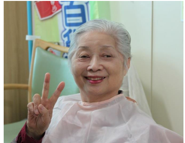
綺麗になって、ピースする参加者