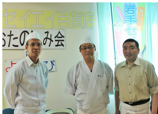
すし組合の皆さん