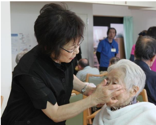
メイクのサービスを受ける参加者