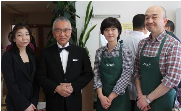
社交飲食業組合の皆さん