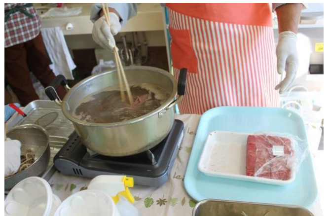
食肉組合から、「しゃぶしゃぶ」を提供いただきました。