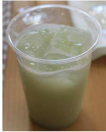
西部理事長自らシェイカーを振り、カクテル（ノンアルコール）を提供いただきました。