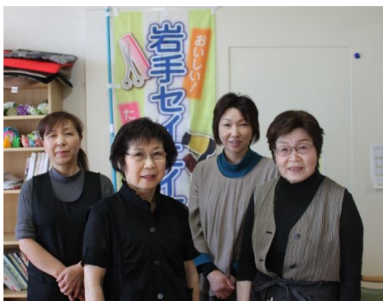
美容業組合の皆さん