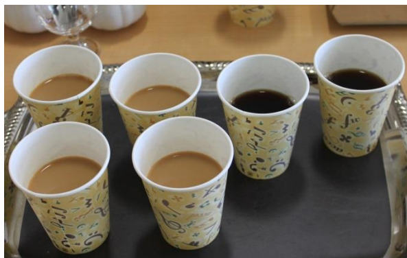
社交飲食業組合から、「本格挽きたてコーヒー」を提供いただきました。