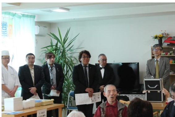
開会の挨拶をする県理容組合 湊理事長