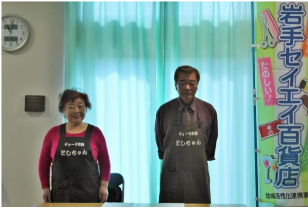
中華料理組合の皆さん