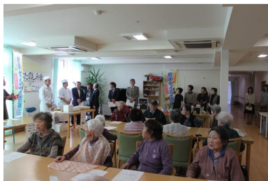
7 組合の皆さんに参加いただきました