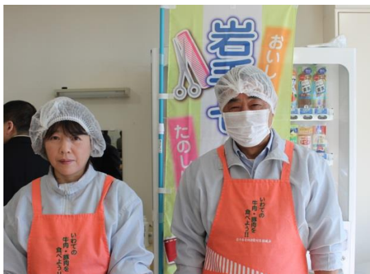
食肉組合の皆さん