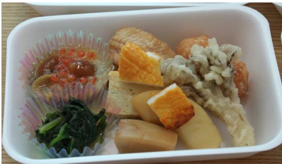
料理業組合から、季節の食材を使用した「前菜」を提供いただきました。