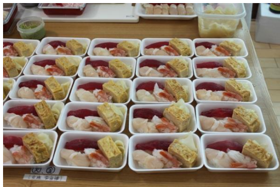
すし組合から、握り寿司を提供いただきました。