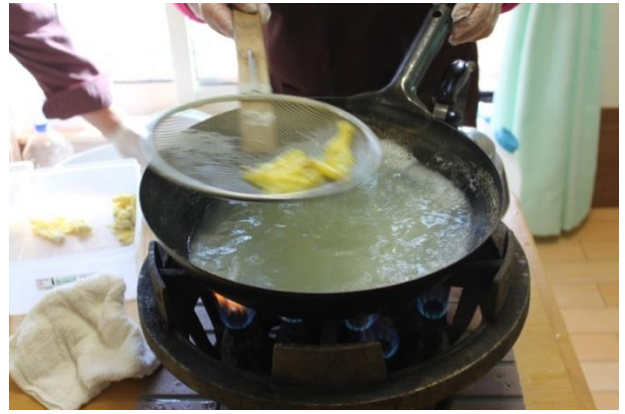
中華料理組合から、「わんたん」を提供いただきました。