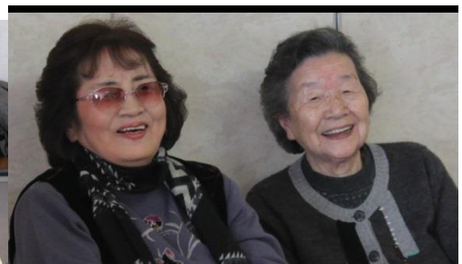
綺麗になって、喜びの参加者