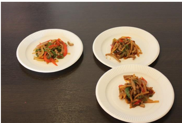
中華料理組合から3品提供（すいぎョーザ、エビチリ、青椒肉絲）