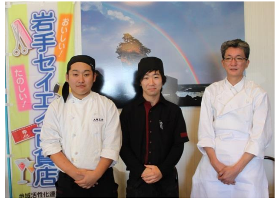
中華料理組合の皆さん