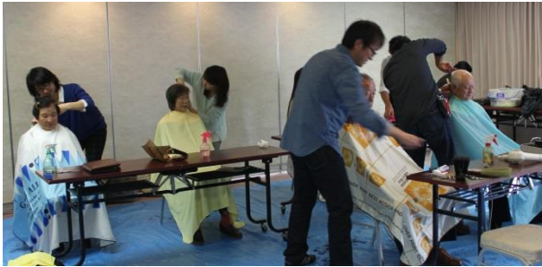
散髪、マッサージのサービスを受ける参加者