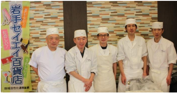
すし組合の皆さん