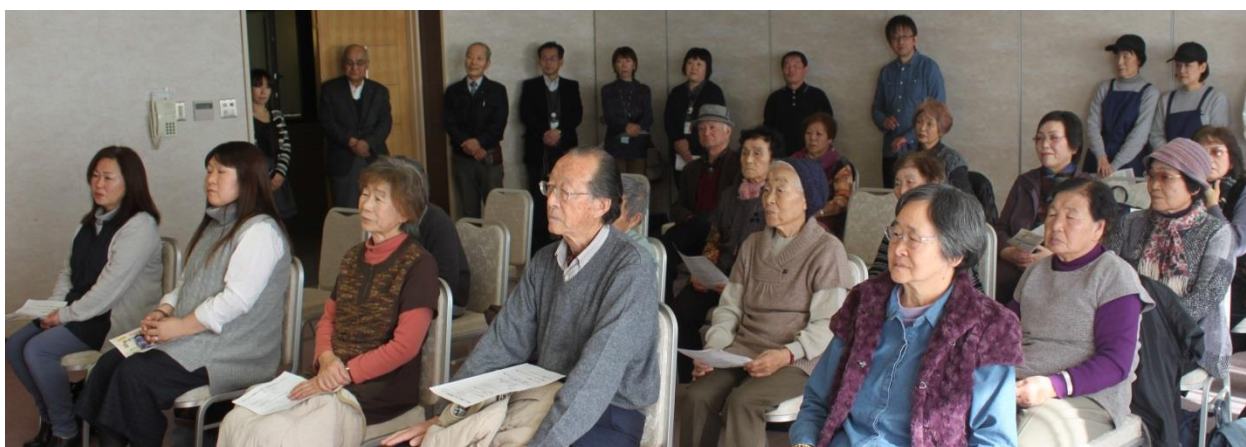
当日は、市内仮設住宅等に入居している 17 名が参加