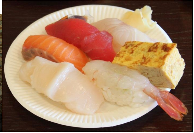
目の前で、握っていただきました。