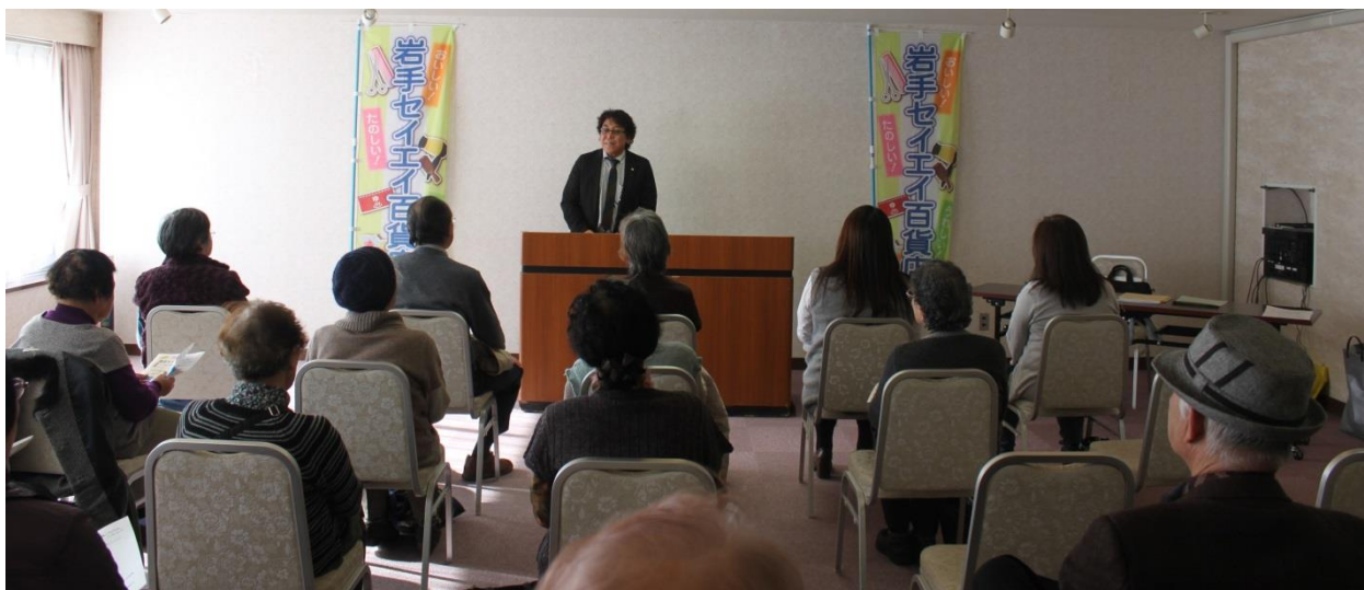
開会の挨拶（岩手県理容組合 湊理事長）