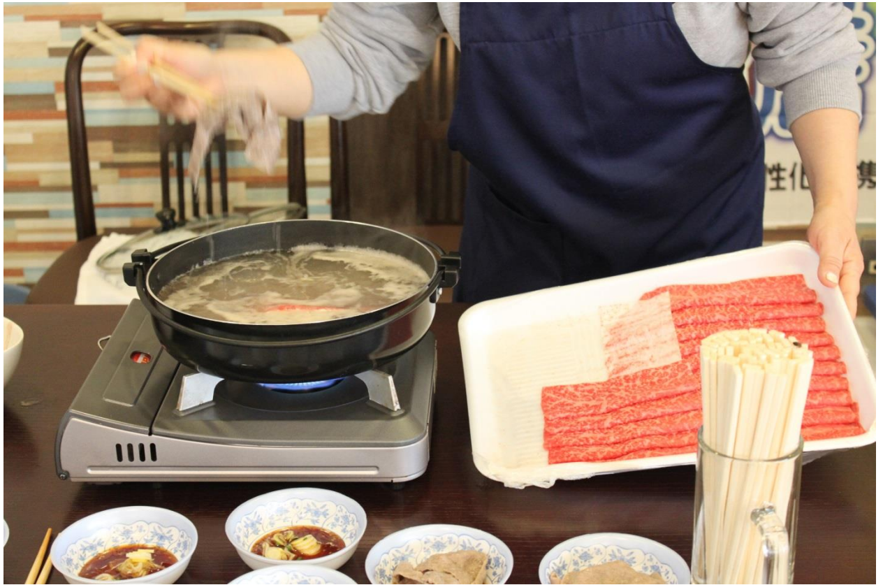
食肉組合から、しゃぶしゃぶの提供