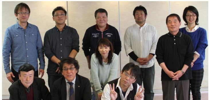
理容組合の皆さん