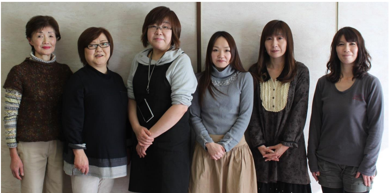
美容業組合の皆さん