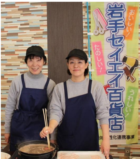
食肉組合の皆さん