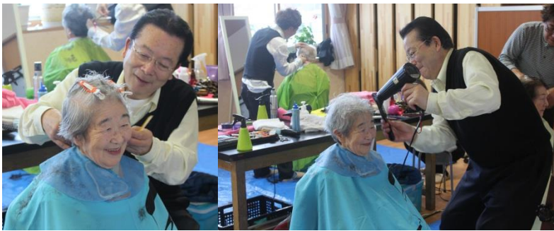
散髪サービスを受ける参加者