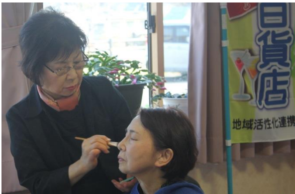
メイクのサービスを受ける参加者