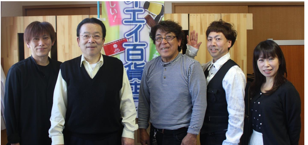
理容組合の皆さん