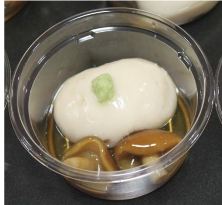
料理業理組合から「芋の子汁」「ごま豆腐」を提供