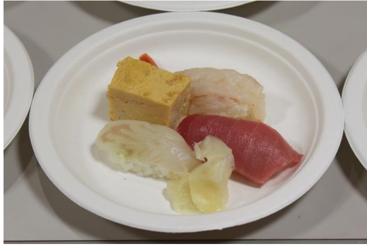
すし組合から、「握り寿司」を提供