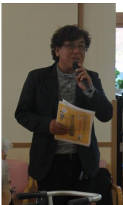
開会の挨拶をする県理容組合 湊理事長