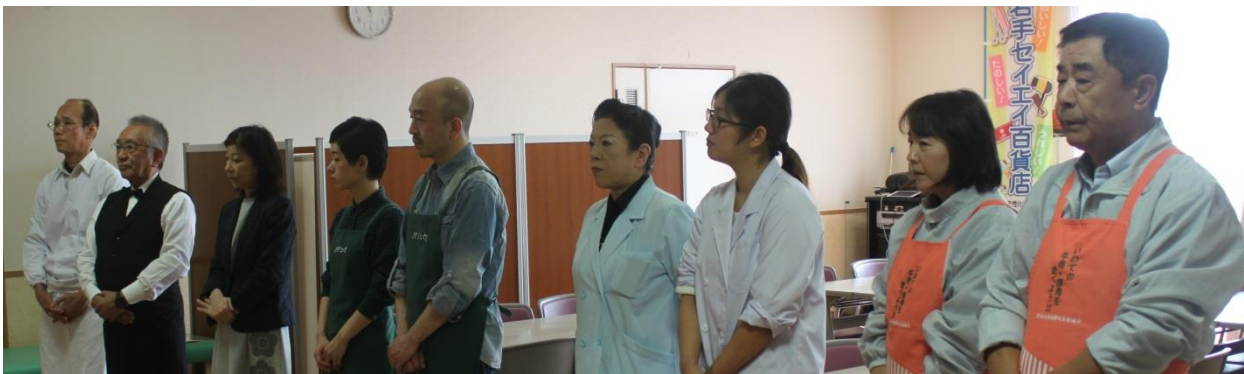
7 組合の皆さんに参加いただきました。