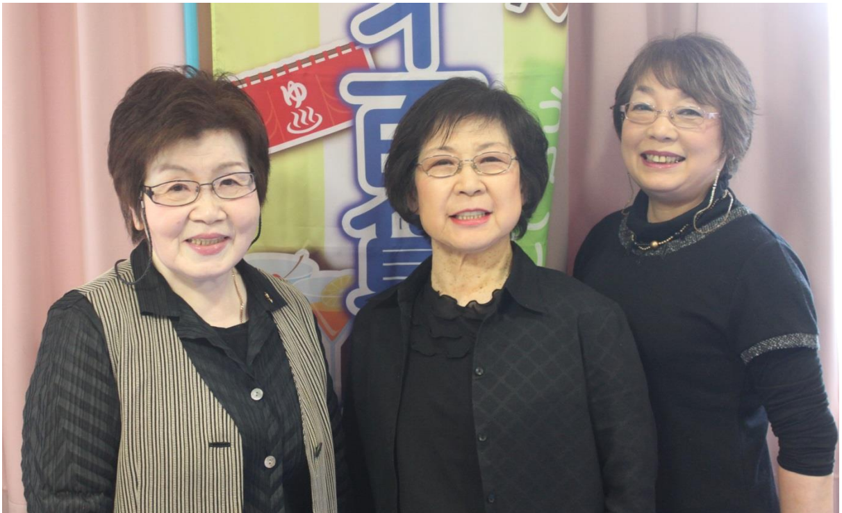
美容業組合の皆さん