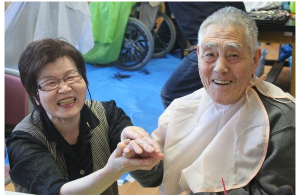
男性もネイルのサービスを受けました。