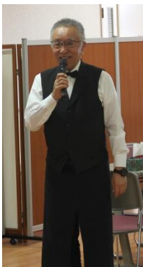
閉会式（県社交飲食業組合の西部理事長から挨拶をいただきました）