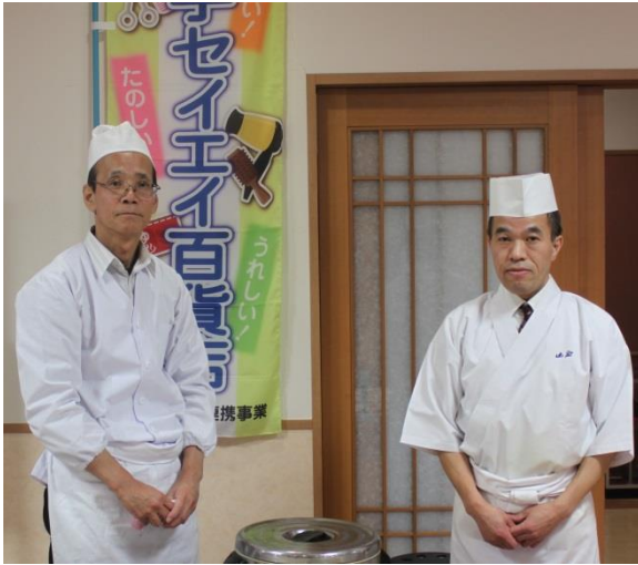
すし組合の皆さん