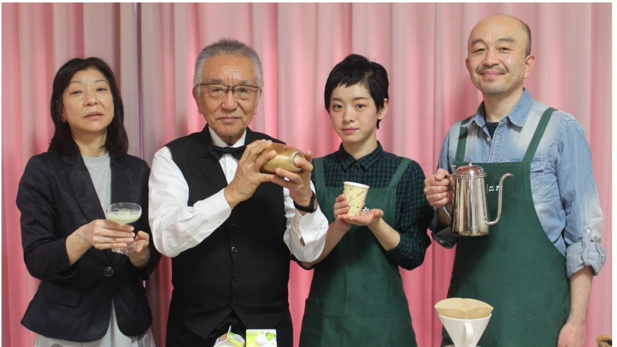
社交飲食業組合の皆さん