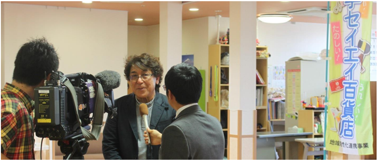
テレビ局（テレビ岩手）のインタビューを受ける県理容組合 湊理事長