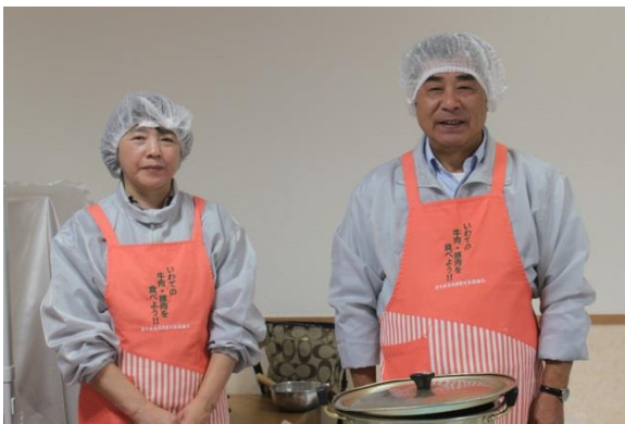
食肉組合の皆さん