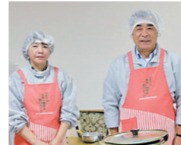
■ 食肉組合(盛岡支部) 竹村精肉店 電話 019-623-1884