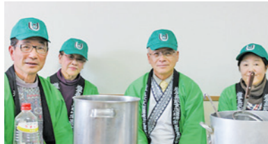
■ 飲食組合(盛岡支部) よんりん舎 電話 019-671-1755