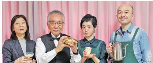
■ 社交組合(盛岡支部) パノニカ 電話 019-623-1666