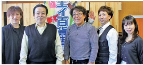
■ 理容組合(盛岡支部) ヘアファッションムゲン 電話 019-687-6577