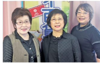
■ 美容組合(盛岡支部) ふじさわ美容室 電話 019-622-5591