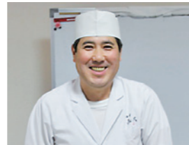
■ 料理組合(盛岡支部) 料理組合盛岡支部 電話 019-622-3643