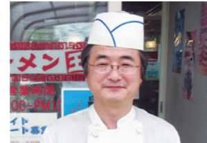
■ 中華組合(盛岡支部) ラーメン王 北山店 電話 019-662-6696