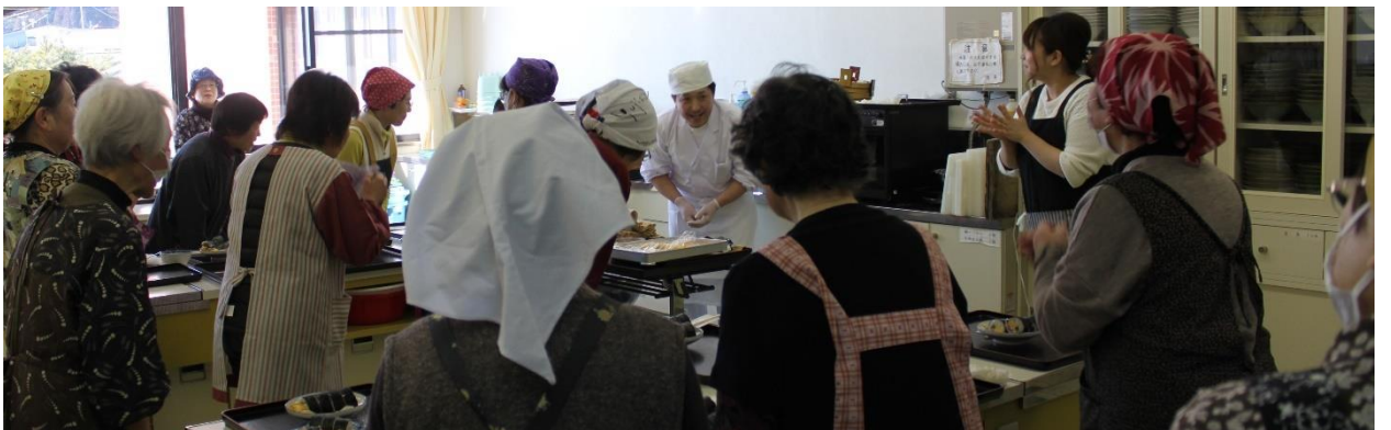
飲食業組合：『美味しい太巻きの作り方』講座