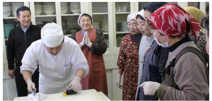
作った太巻きに喜びの皆さん 上手にできました。