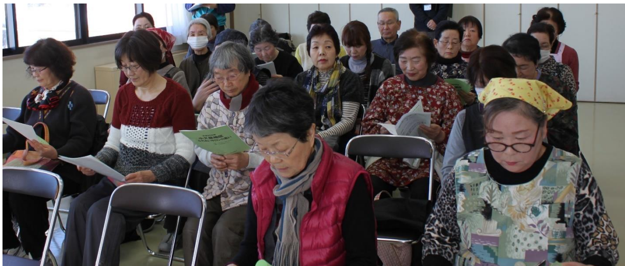
小久慈町地域の参加者の皆さん（当日は 24 名が参加）