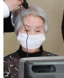
理容組合：毛髪診断&『正しいシャンプーの仕方』講座（15名が毛髪診断を受診しました）