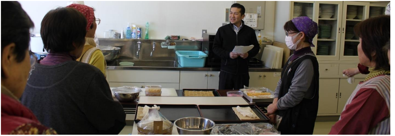
この日は、全員が「太巻き作り」に挑戦しました。