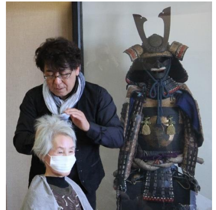
湊理事長からモデルによる実地講義がありました。