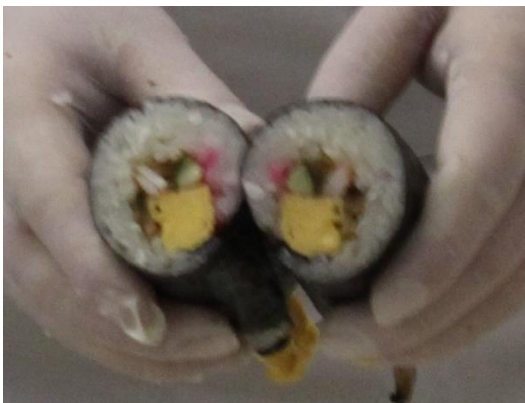
ウサギ模様になりました！