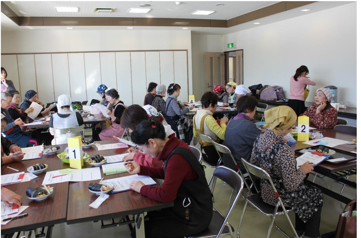
参加者全員が試食前にアンケートを記入いただきました。