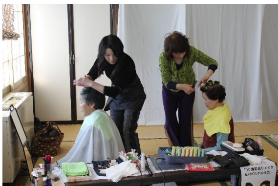
美容業組合：『10歳若返りメイク&スタイリングの仕方』講座