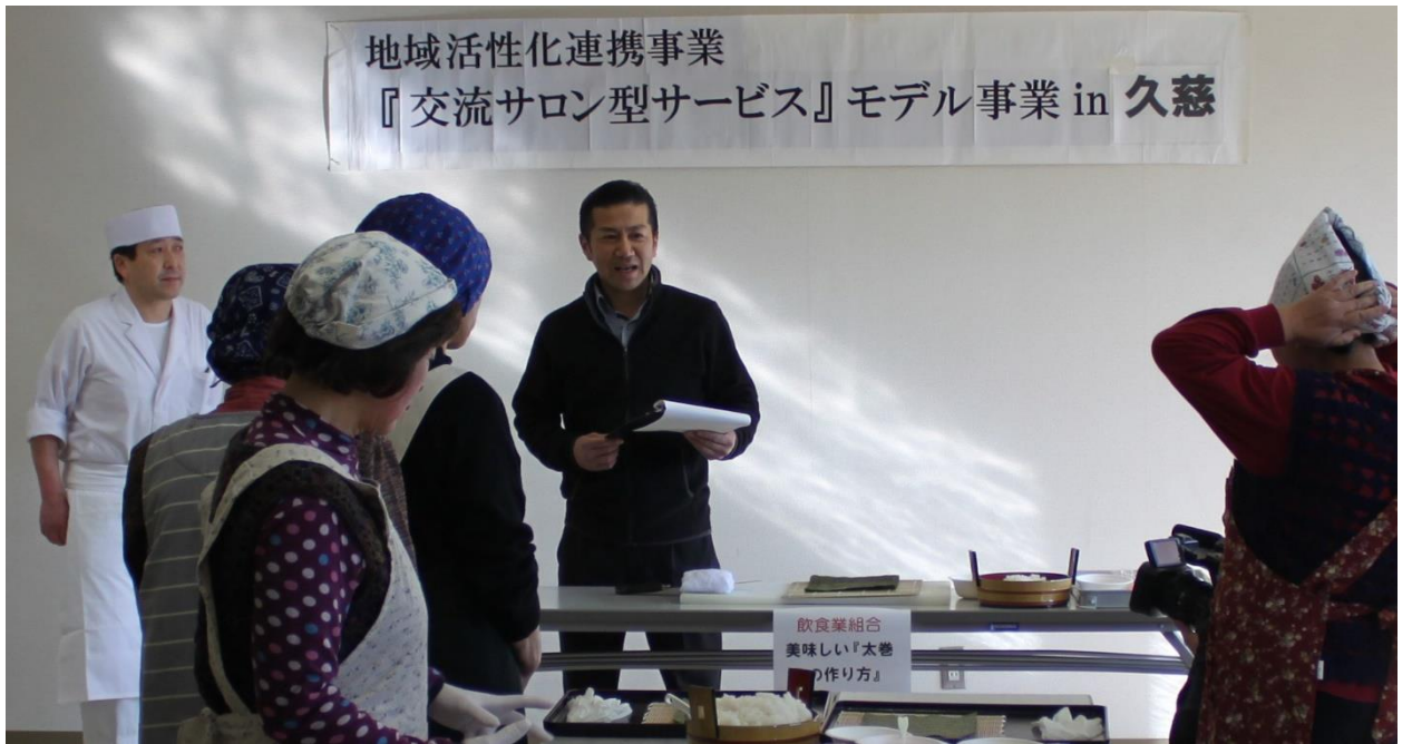
飲食業組合：『美味しい太巻きの作り方』講座 この日は、全員が「太巻き作り」に挑戦しました。