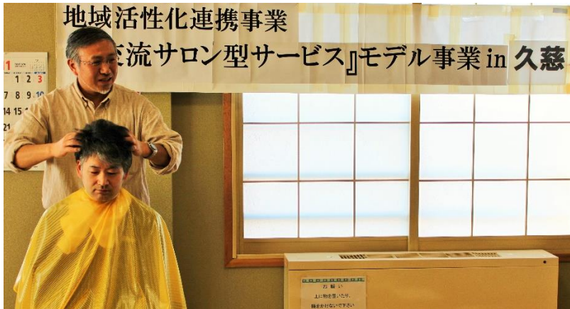
理容組合：頭皮診断&『正しいシャンプーの仕方』講座（5名が頭皮診断を受診）