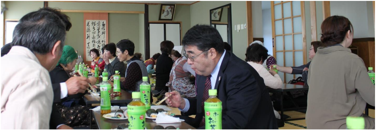
参加者全員とスタッフで試食会