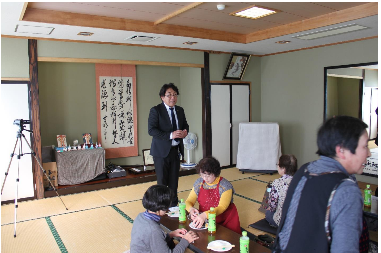
閉会挨拶（湊理容生活衛生同業組合理事長）