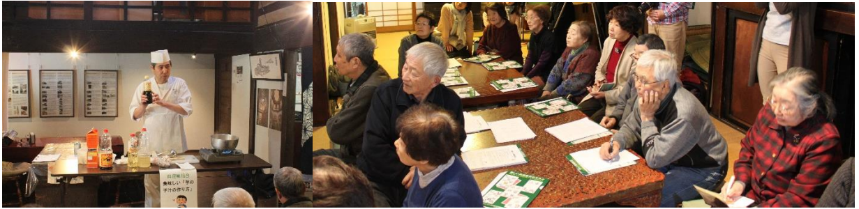
料理業組合：『美味しい芋の子汁の作り方』講座