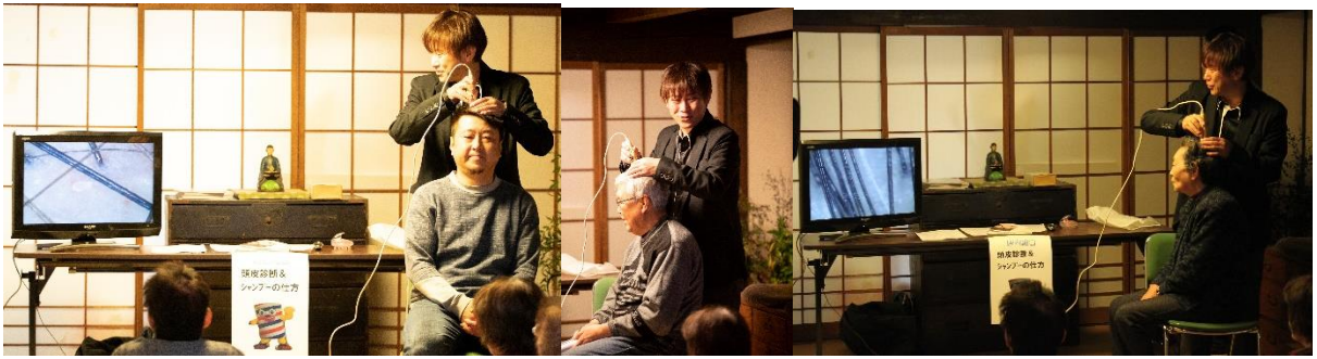
理容組合：頭皮診断&『正しいシャンプーの仕方』講座