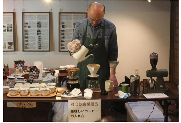
社交飲食業組合：『家庭でできる美味しいコーヒーの入れ方』講座 講師のトークに会場は盛り上がりました。