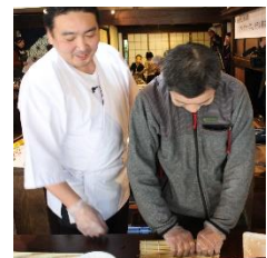
男性も太巻き作りに挑戦しました。