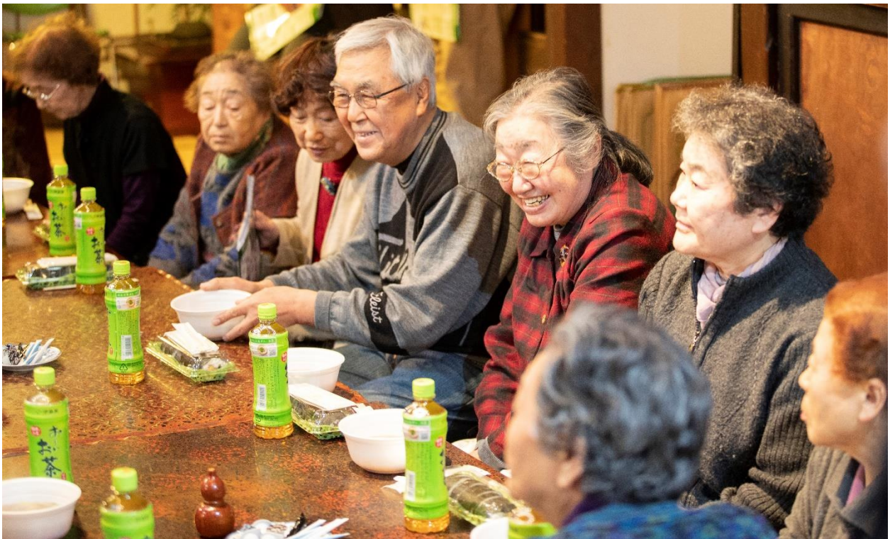
参加者全員で試食しました。