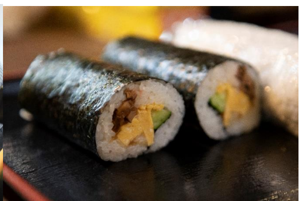
すし業組合：『美味しい太巻きの作り方』講座