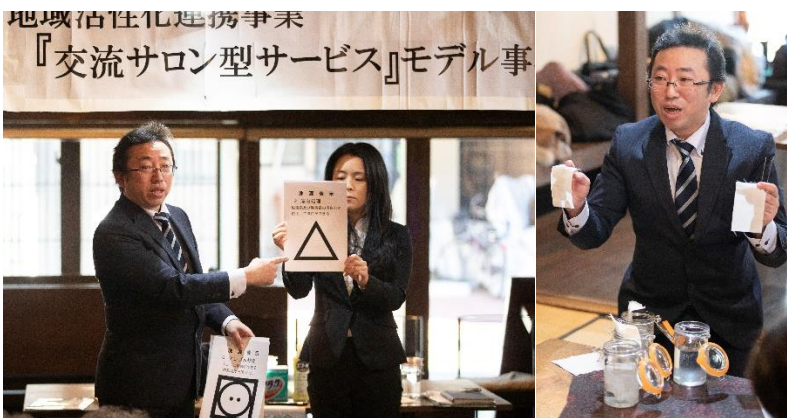
クリーニング組合：『失敗しない家庭洗濯の仕方』講座