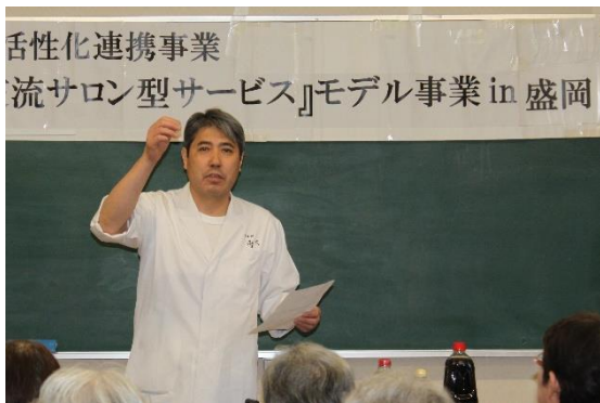
料理業組合：『美味しい芋の子汁の作り方』講座