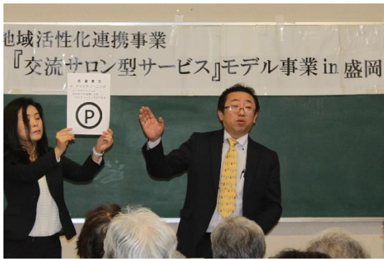
クリーニング組合：『失敗しない家庭洗濯の仕方』講座