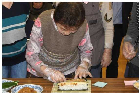
すし業組合：『美味しい太巻き寿司の作り方』講座