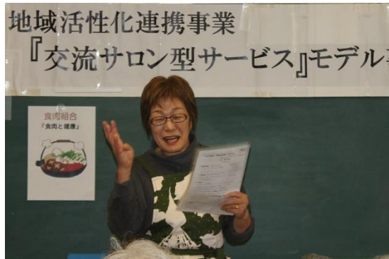
レシピを配布しました。