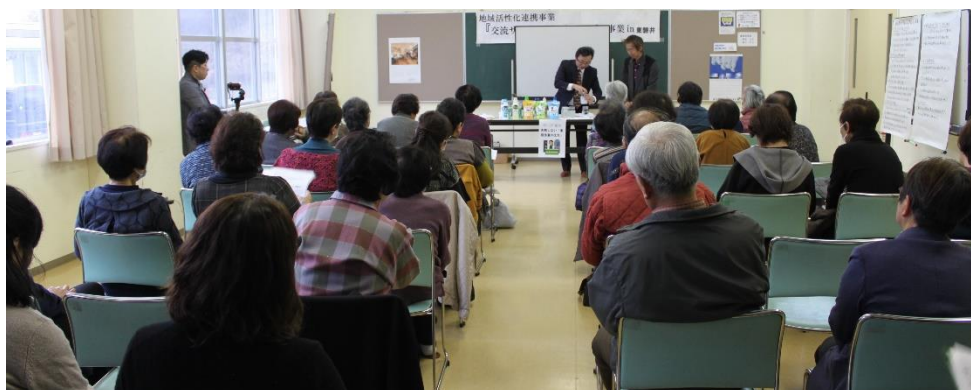
クリーニング組合：『失敗しない家庭洗濯の仕方』講座