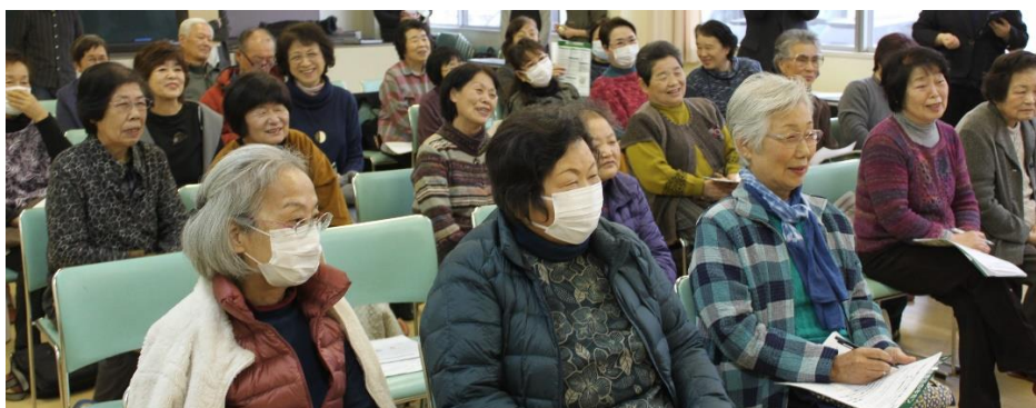
地域の参加者の皆さん（当日は 27 名参加）