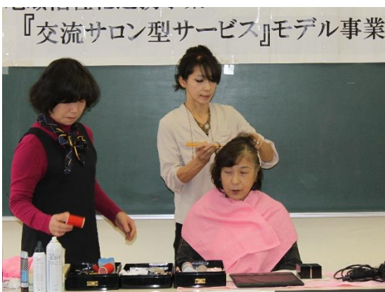
参加者にモデルになったいただきました。