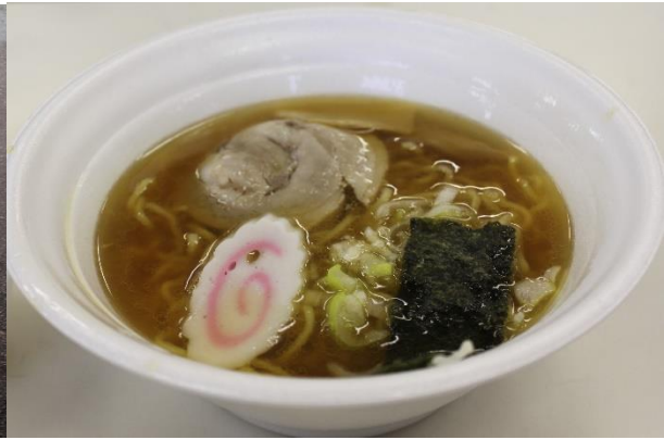
中華料理組合：『ラーメンの作り方』講座