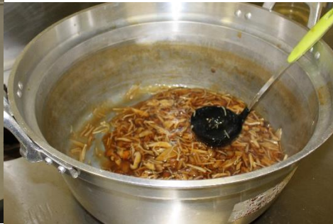
中華料理組合：『美味しい料理の作り方』講座（鱈の竜田揚げキノコ餡かけ）