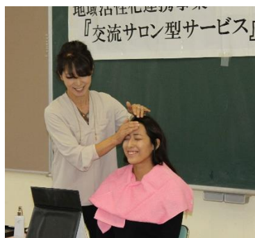
最初はメークの仕方を披露（若いモデルさん）