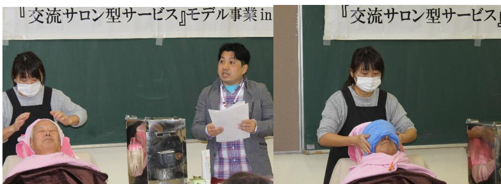
理容組合：『蒸しタオルでのリフレッシュ（アイスパ）』講座