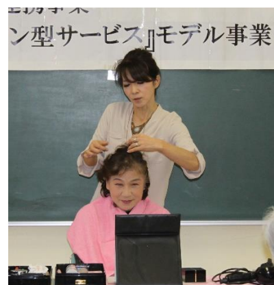
鏡を見て喜びの参加者