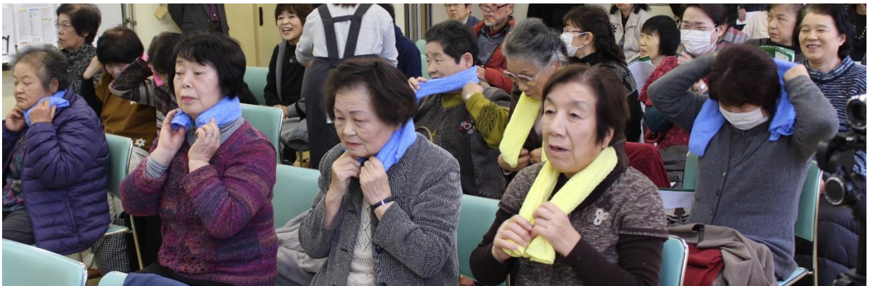
モデル以外の会場の方全員に、蒸しタオルを体験いただきました。