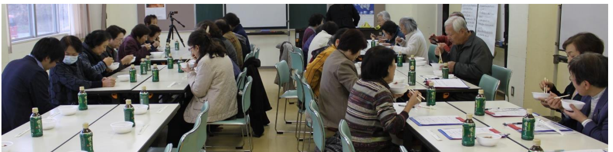
参加者全員で試食しました。