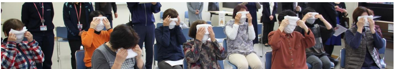
参加者全員に、蒸しタオルを体験いただきました。