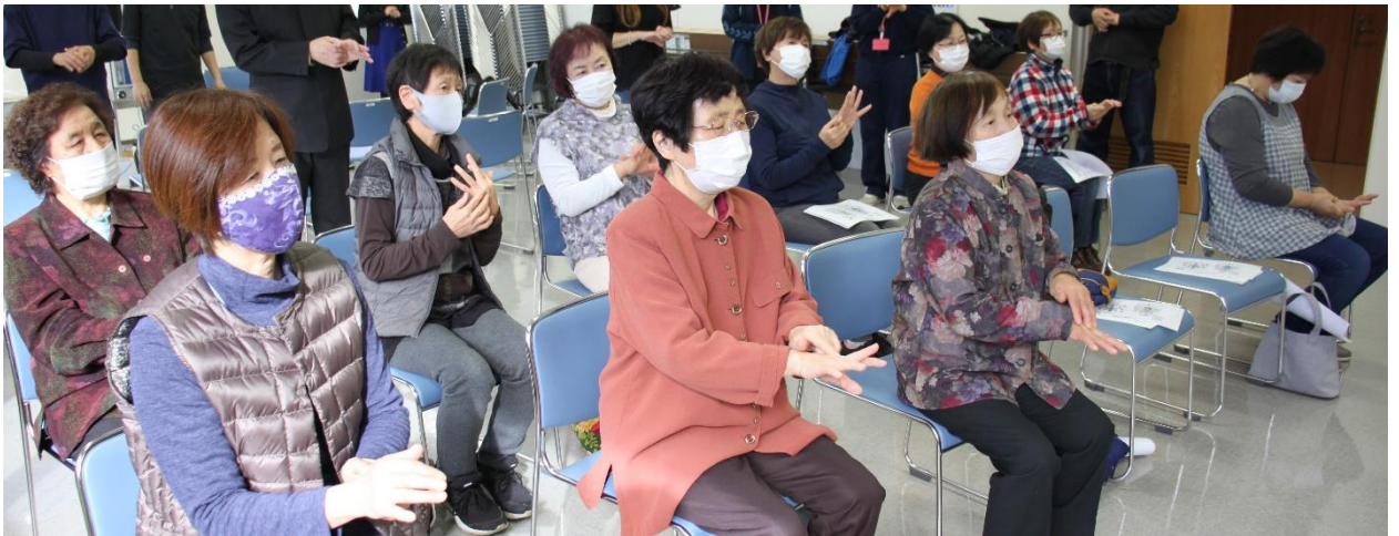
参加者全員に、マッサージの仕方を講義