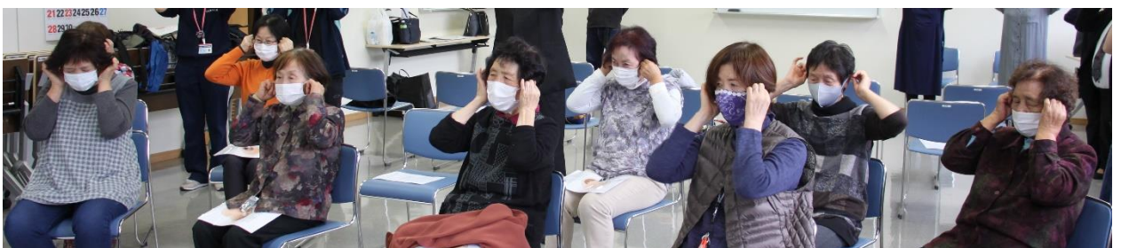
耳マッサージはモデルへの講義を参考に、マッサージの効能等全体説明がありました。