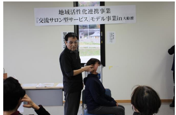
耳マッサージ講義