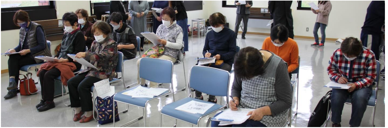
参加者全員にアンケートに記入いただきました。