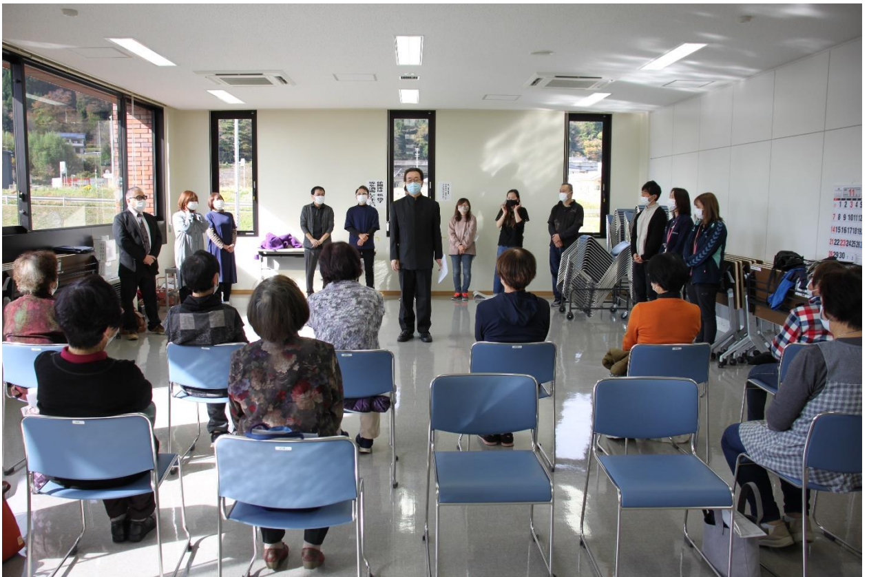
参加者から、感想なども発表いただきました。