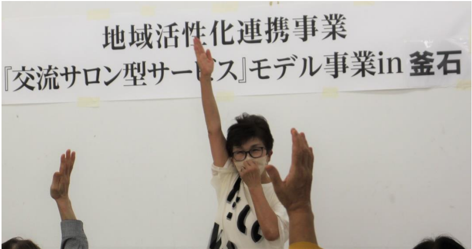
参加者全員に、マッサージの仕方を講義