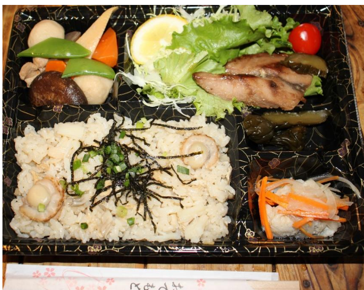
帆立の炊き込みご飯お弁当