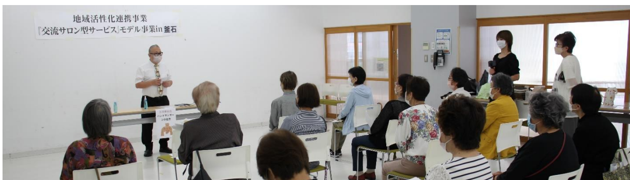
地域の参加者の皆さん（当日は14名参加）