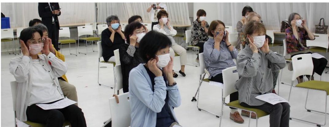
耳マッサージは講義を参考に、マッサージの効能等全体説明がありました。