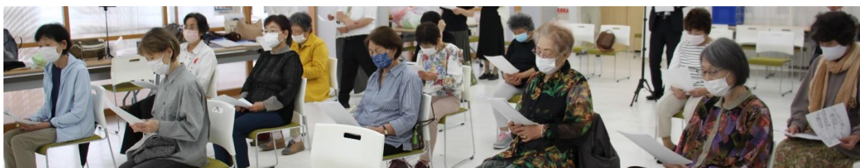
熱心に講義を聴く参加者の皆さん