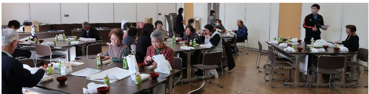
参加者全員で試食