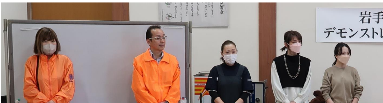
中華料理組合東磐井支部