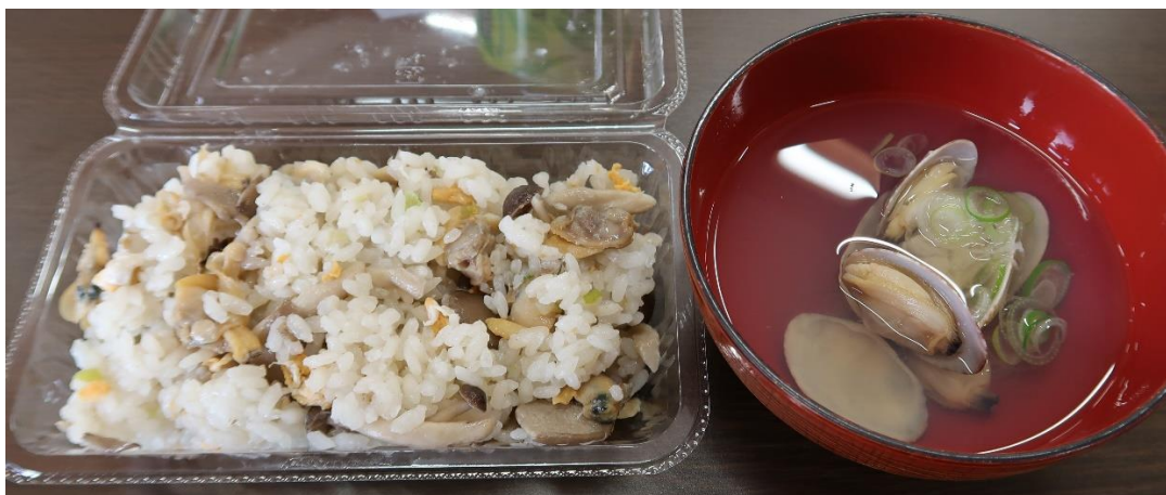
チャーハン風味の混ぜご飯