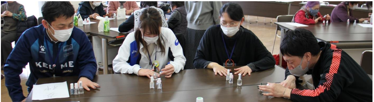
社会福祉協議会の皆さんも体験参加しました