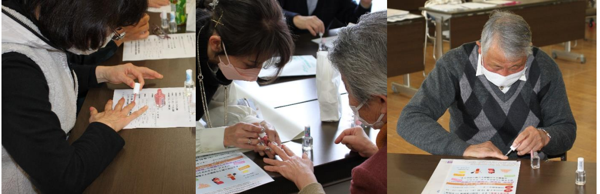
真剣にネイルに取り組む参加者の皆さん