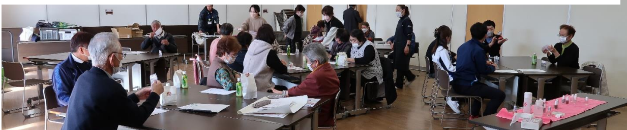
美容業組合東磐井支部