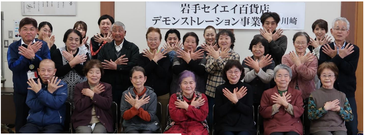
参加者、講師、スタッフ全員で、記念撮影