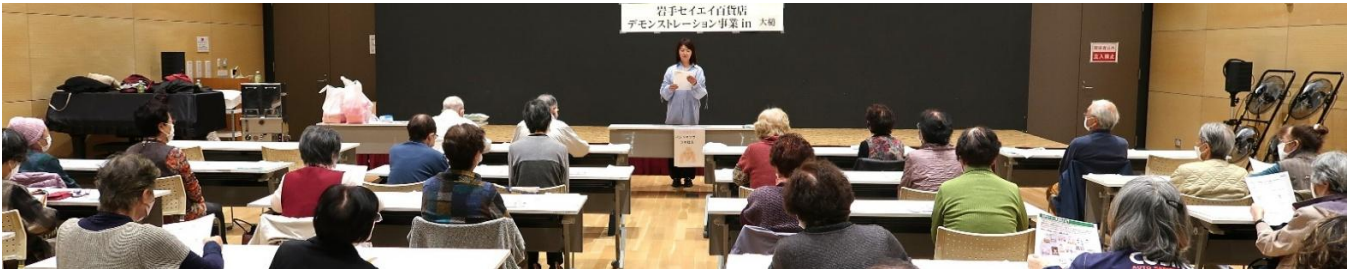
美容業組合の皆さん