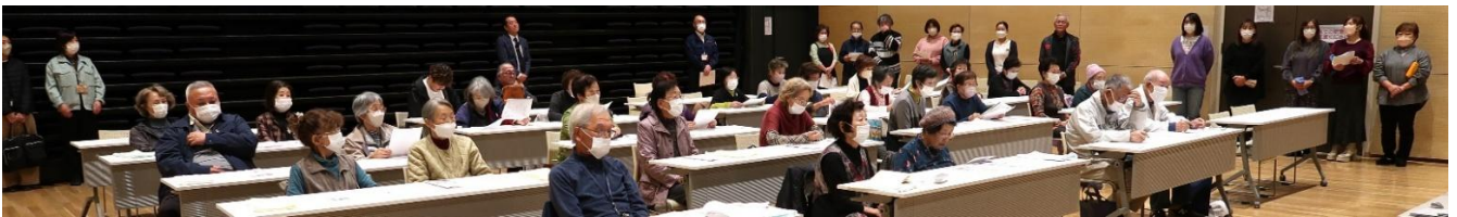
地域の参加者の皆さん（当日は、30名参加）