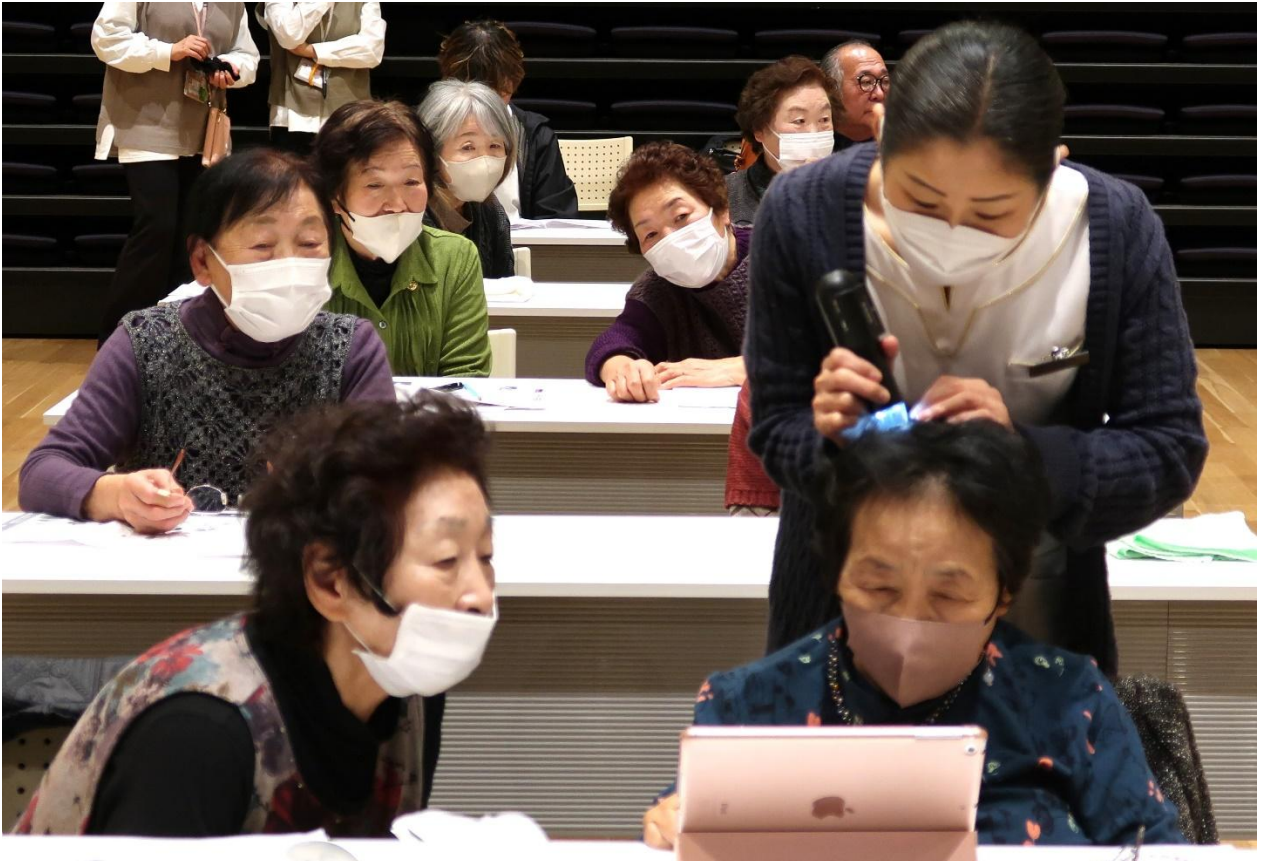
頭皮診断も行いました。 周りの人も気になります。