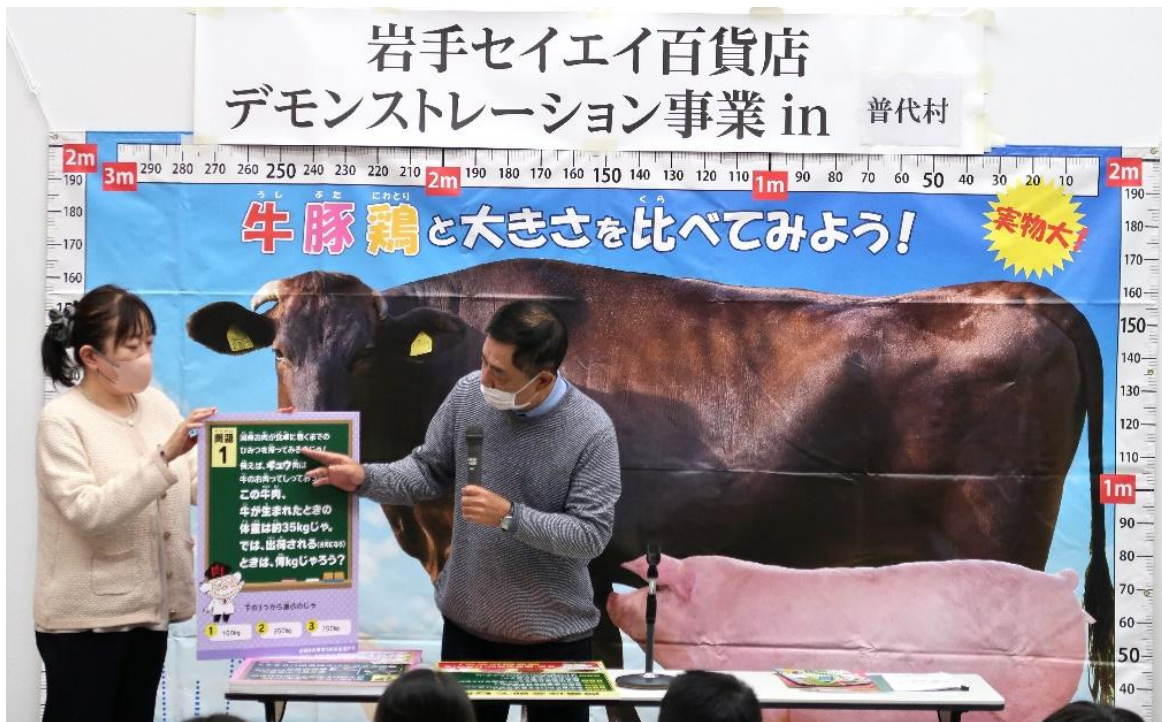
パネルを使用して、おにく博士のクイズにもチャレンジしました。