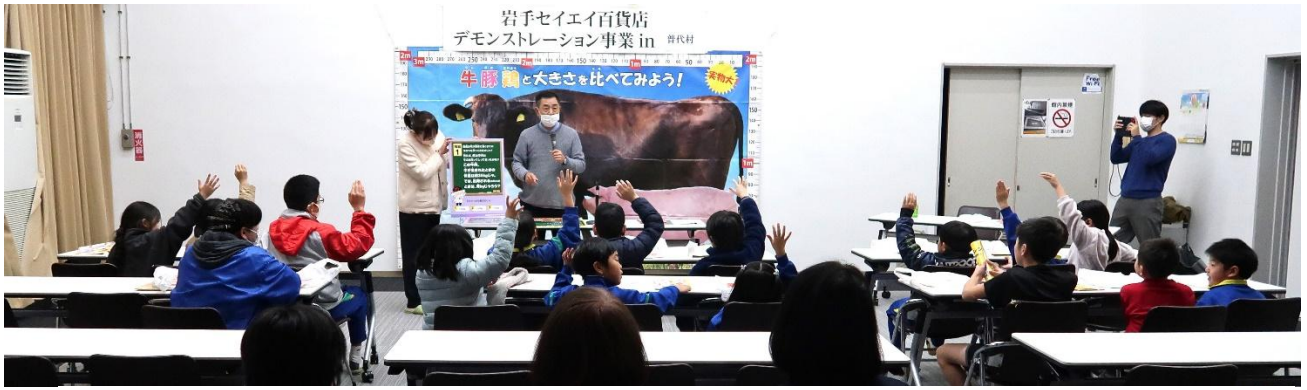
手を挙げて、積極的に答えていただきました！