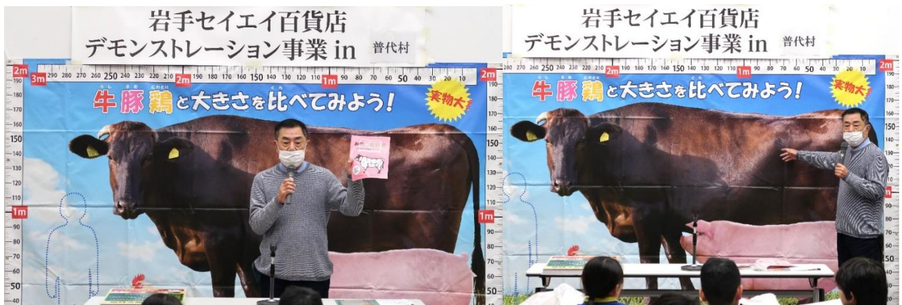
テキスト「お肉の教科書」などを使用して、わかりやすく講義いただきました。