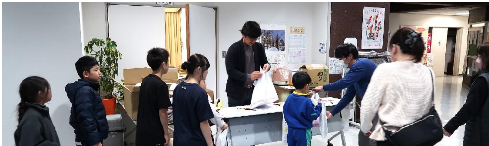
参加者の皆さんに『お弁当』を、お持ち帰りいただきました。