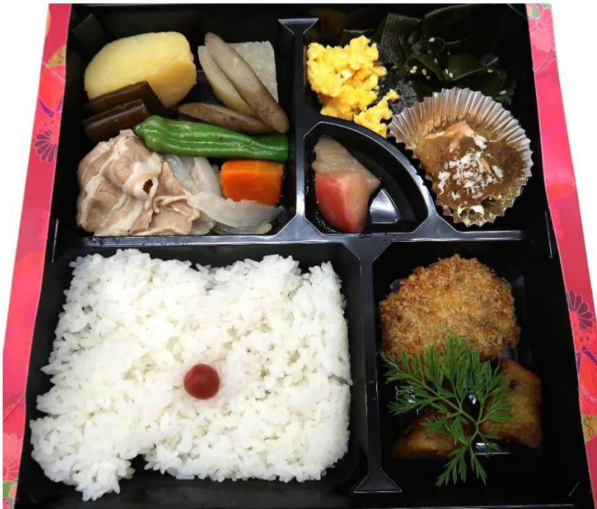
メンチカツなどを使用した「お弁当」を作っていただいた上神田精肉店（Cafw AWAI 協力）