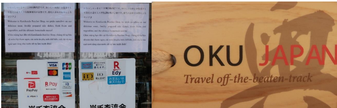
昨年から外国人旅行者の来店が増えてきたとのこと。