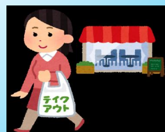
テイクアウト メニュー表作成