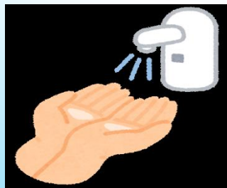
センサー式の 水道蛇口