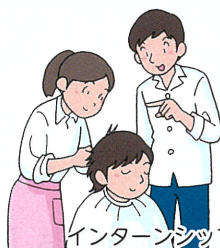
インターンシップの実施

組合を窓口とした日本政策金融公庫の低金利・長期返済の融資により経営の安定を支援しています。