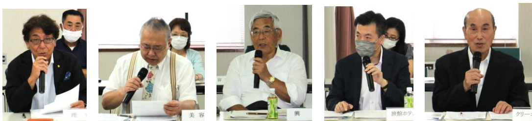
理容組合理事長 美容業組合理事長 興行組合理事長 旅館ホテル組合事務局長 クリーニング組合理事長