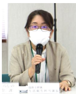
技術主幹兼生活衛生担当課長