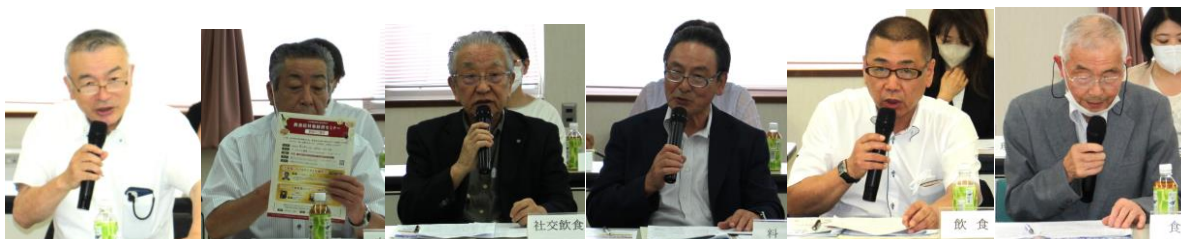
すし組合理事長 中華組合理事長 社交組合理事長 料理業組合理事長 飲食業組合理事長 食肉組合理事長