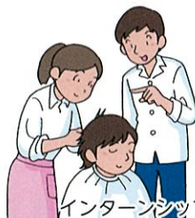
インターンシップの実施

組合を窓口とした日本政策金融公庫の低金利・長期返済の融資により経営の安定を支援しています。