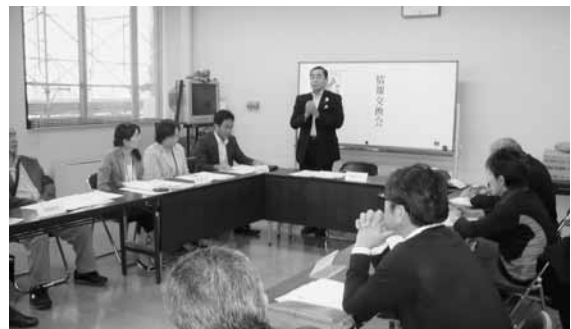
情報交換会(鈴鹿) 26年10月9日