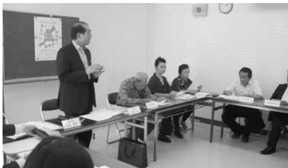
情報交換会(桑名) 26年10月7日