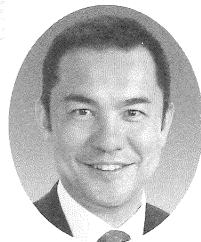
三重県知事 鈴木英敬