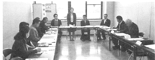
10月24日 (伊 賀)