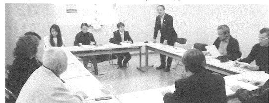
10月31日 (尾 鷲)