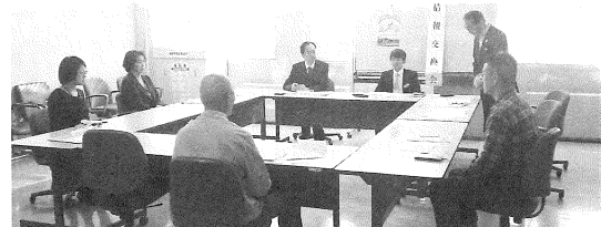
10月30日 (熊 野)