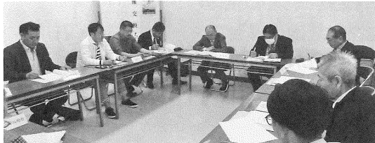
10月16日 (桑 名)