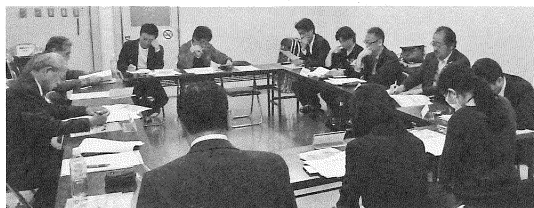
10月17日 (鈴 鹿)