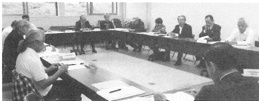
10月6日 (伊 勢)