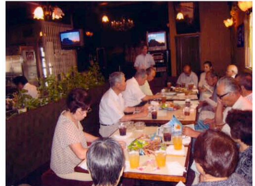
「地域住民との交流会 H24.8.28 (火) 大田原市パブレストラン風見鶏

社交飲食業では、昨年度の「地域ふれあいたすけあい事業」において、大田原支部の加治屋地区自治会役員と老人クラブを招いて「モデル店」を開催、初めてのスナックでカラオケを楽しむキッカケが出来たと、老人会によるこばれ町内会の話題を呼び、地域内で営業する生衛業アウトサイダー6店が、社交飲食業生衛組合に入会すると言う大きな成果を上げることが出来た。