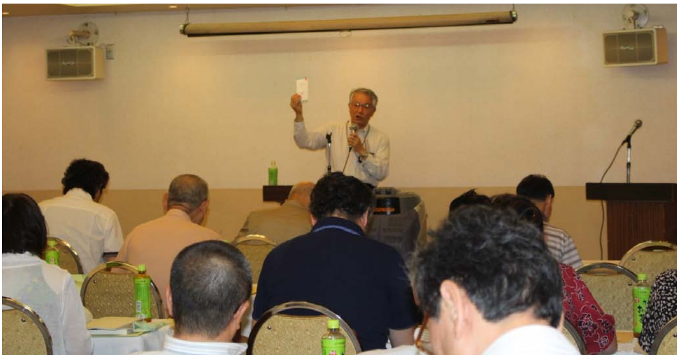
(県南会場での研修会の様子)

平成28年7月及び8月、平成28年度生活衛生営業経営特別相談員研修会を県北・県央・県南ブロックの3会場に分けて177名の経営特別相談員を対象に開催したところ、113名が受講されました。