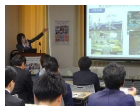
雇用支援セミナー