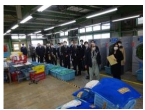
刑務所・少年院スタディツアー