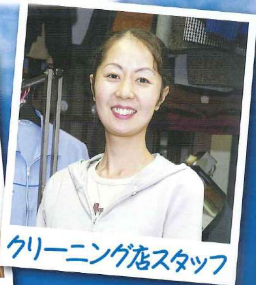
クリーニング店スタッフ