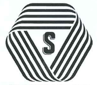
厚生労働大臣認可 標準営業約款・Sマーク

詳細は、(公財)東京都生活衛生営業指導センター ☎ 03 (3445) 8751 までお問い合わせ下さい。