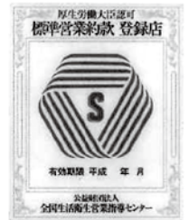
標準営業約款登録店標識