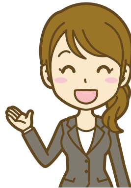
厚生労働大臣認可