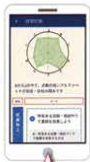
診断結果のチャートが表示