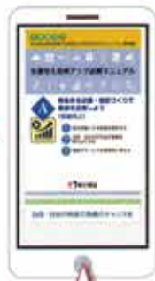
テーマに関連したマニュアルを閲覧できます

各設問に回答することにより、収益向上、顧客満足度、労働環境改善などのテーマごとに自店の経営診断ができます。