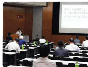
特相員研修(山口市)

また、当センターでは、これから経営特別相談員になられる方を対象とした新規特別相談員養成講習を1月19日及び2月7日に実施します。