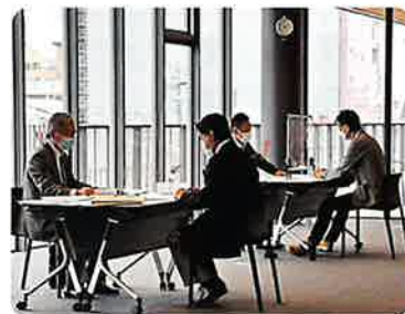
相談会会場(周南市)

令和3年12月27日現在、融資相談、助成金、給付金等の相談が928名の方から寄せられ、各組合の経営特別相談員や社会保険労務士、税理士等の専門家が相談対応をされました。