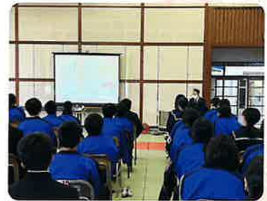
出前授業の様子(一部です。)